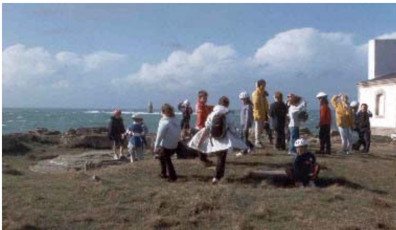
Le 12 octobre à l'Île d'Yeu