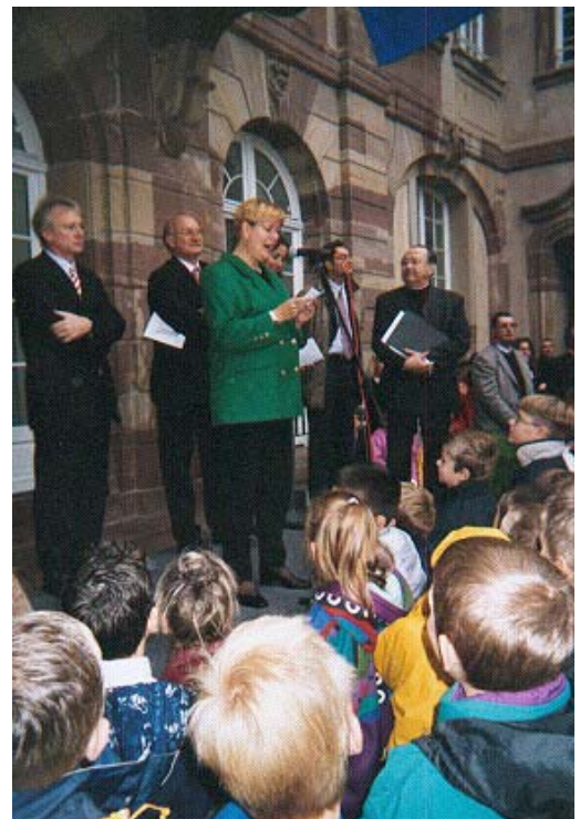
Le 12 octobre à Saint Joseph